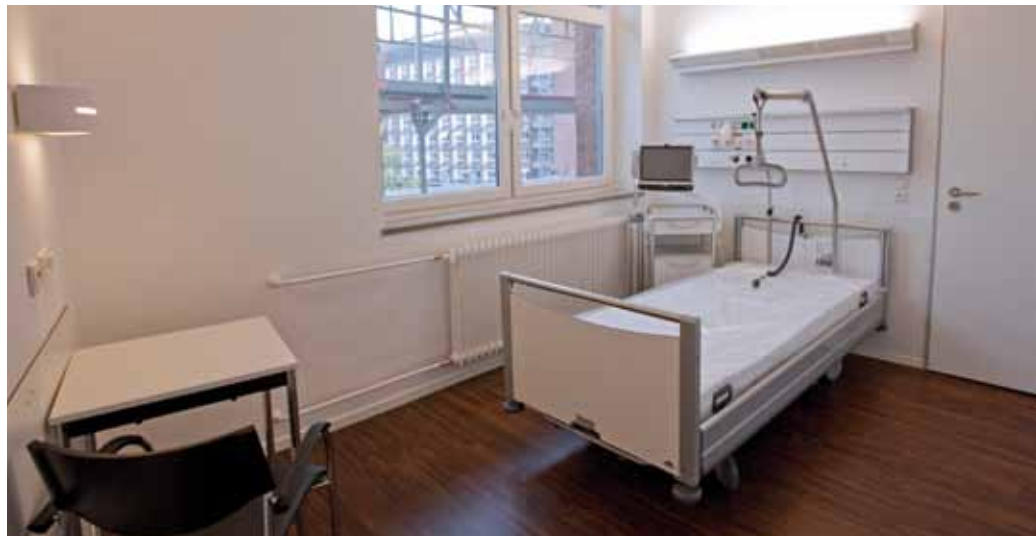
Die Isolierzimmer in den Etagen 4 bis 6 sind mit vorgelagerten Schleusen versehen. Die spezielle Lüftungsanlage der Leukämiestation (5. Etage) ermöglicht die erforderliche Luftqualität