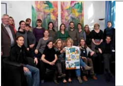
Nimmt die hausärztliche Versorgung in Hamburg unter der Lupe: Das Institut für Allgemeinmedizin