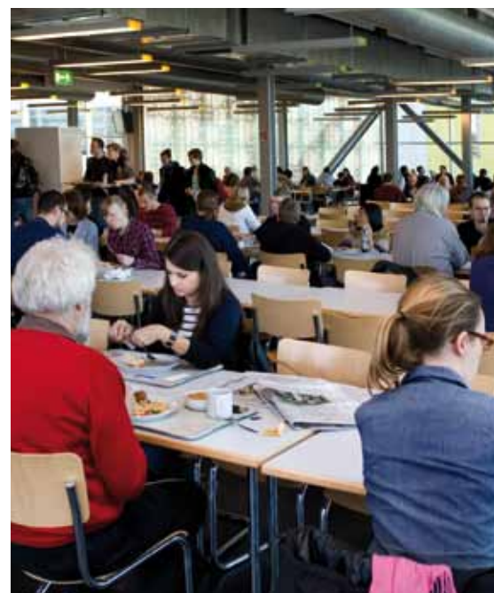
Kein Fleisch auf dem Teller, und den Mitarbeitern schmeckt’s: Pro Woche spart das UKE dadurch 940 Kilogramm CO 2 (45 Tonnen im Jahr) ein – ein stolzer Beitrag für die Umwelt