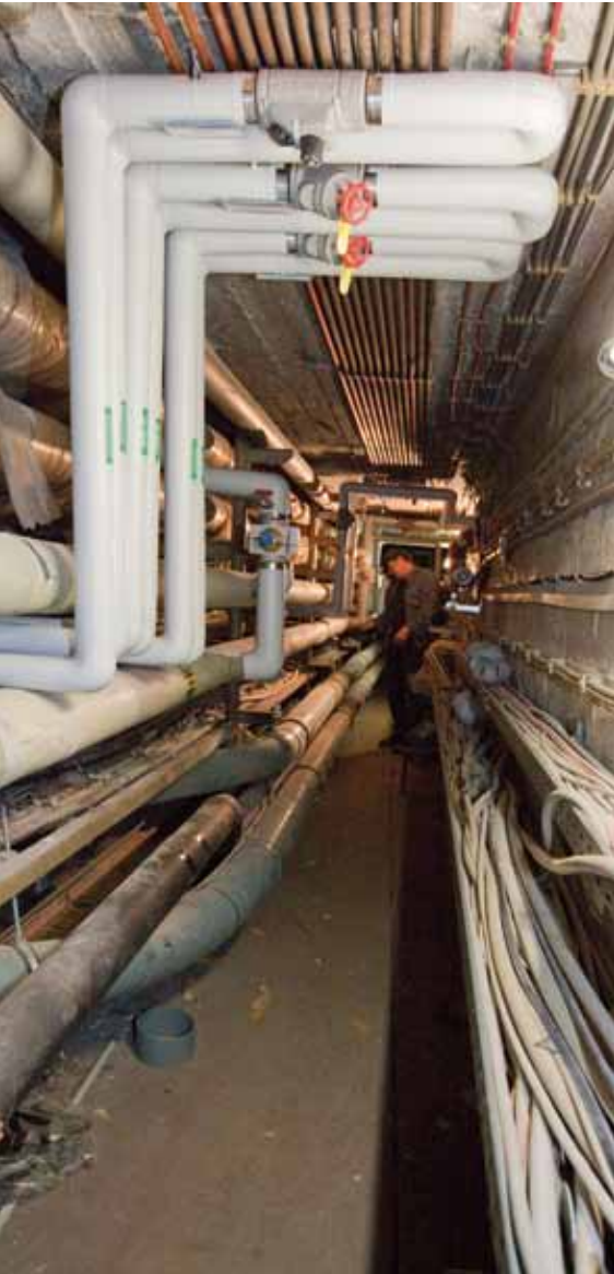
Die neuen Rohrleitungen für den Westflügel wurden durch das Sockelgeschoss geführt