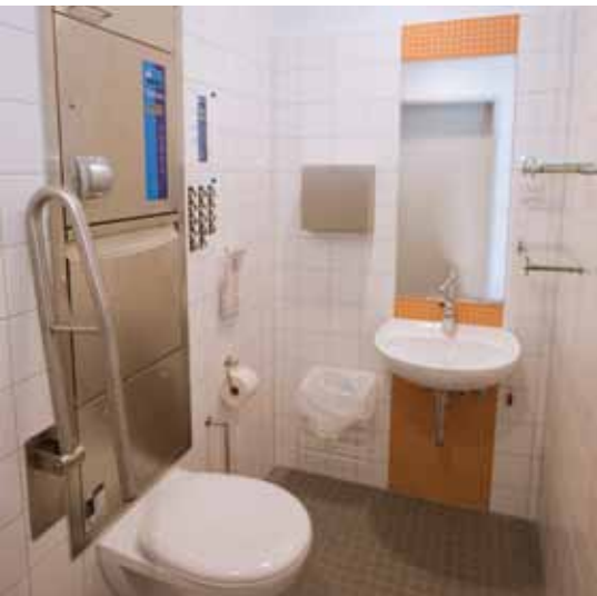
Die Bäder sind zweckmäßig und barrierefrei ausgestattet